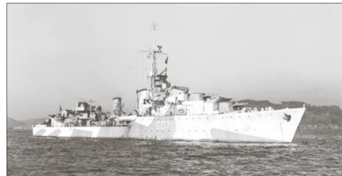
Tribal-class destroyer HMCS Athabaskan.