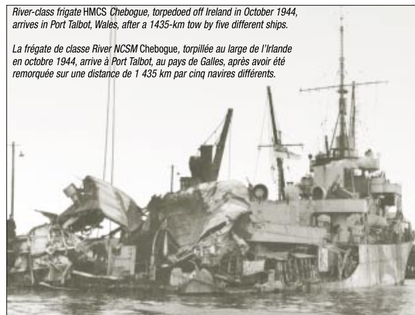
River-class frigate HMCS Chebogue, torpedoed off Ireland in October 1944, arrives in Port Talbot, Wales, after a 1435-km tow by five different ships.